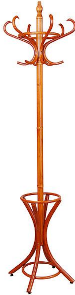
Ad.5 Wieszak z parasolnikiem drewniany