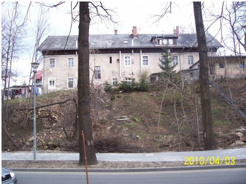
Rys.4 Elewacja zachodnia