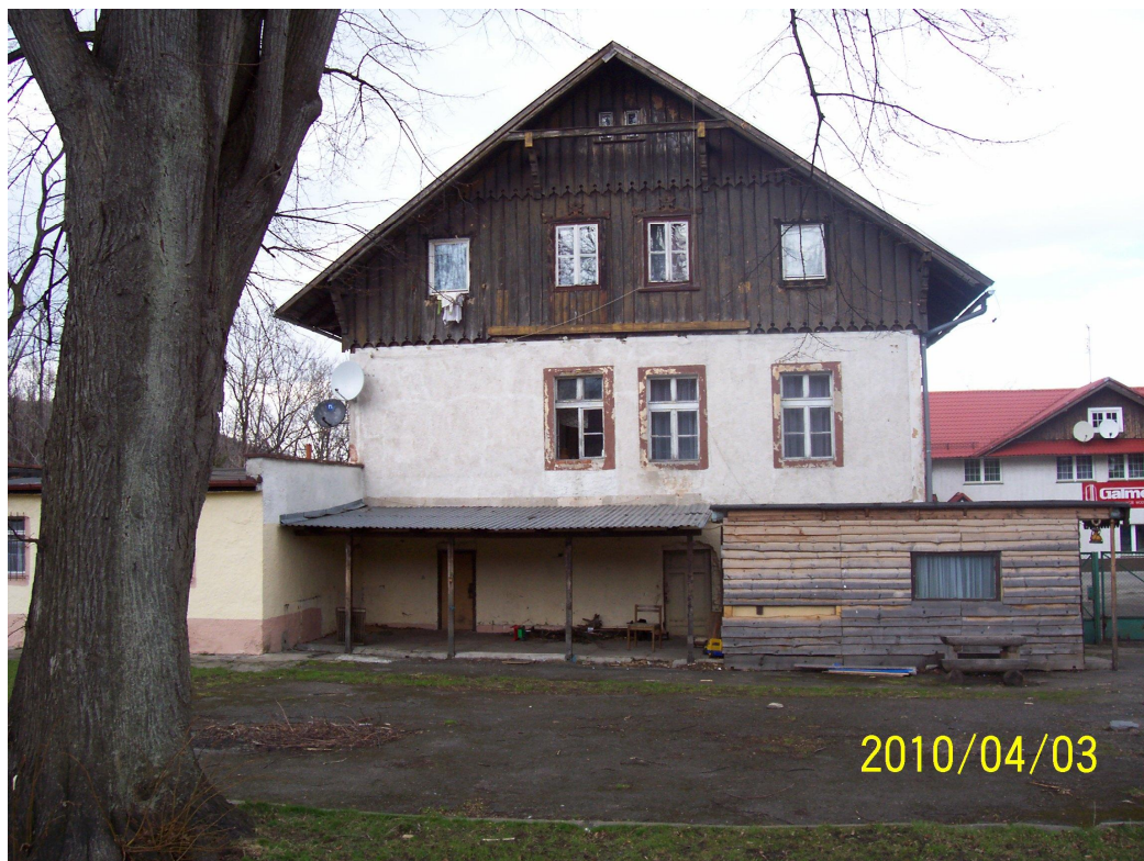
Rys.2 Elewacja południowa