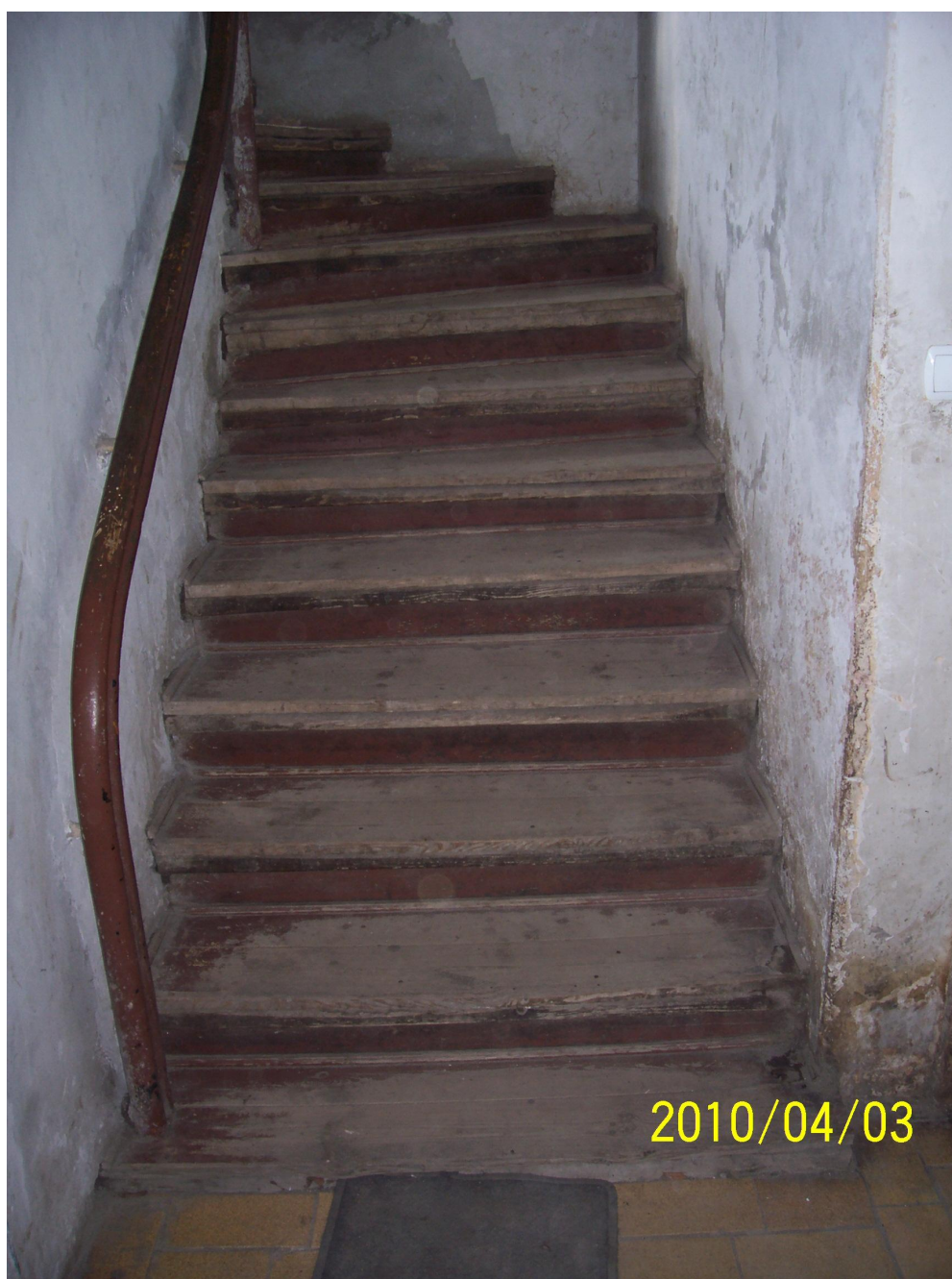
Rys.5 Klatka schodowa parter.