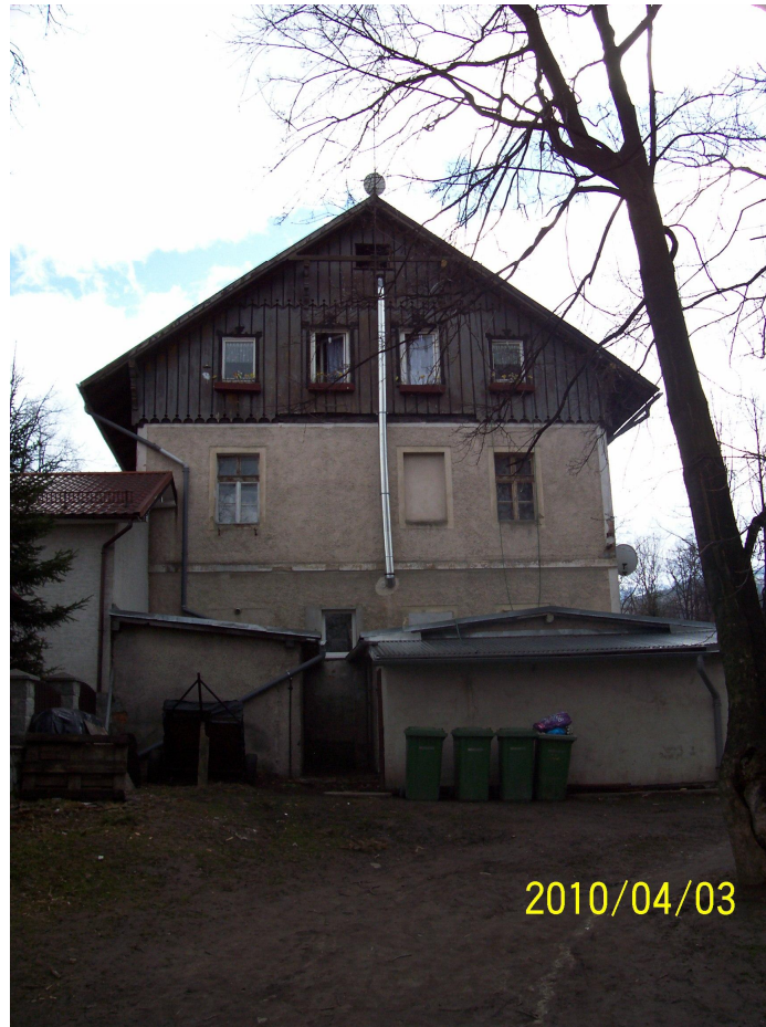
Rys.3 Elewacja północna