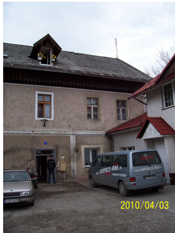
Rys.1 Elewacja wschodnia.