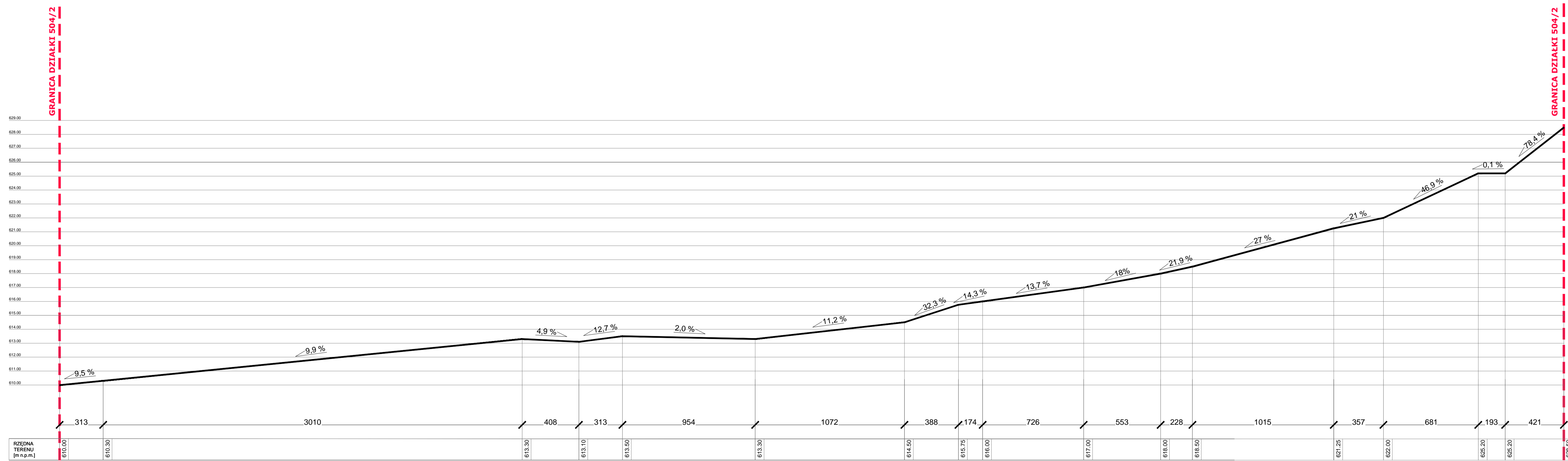
MIEJSKI PLAC ZABAW W KARPACZU STAN ISTNIEJĄCY - PRZEKRÓJ A-A SKALA 1:160